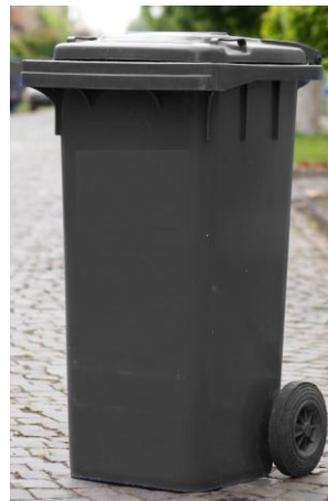
120 L nádoba