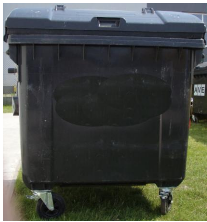
1100 L nádoba