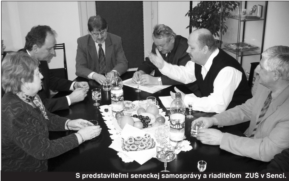
S predstaviteľmi seneckej samosprávy a riaditeľom ZUŠ v Senci.