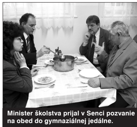
Minister školstva prijal v Senci pozvanie na obed do gymnaziálnej jedálne.

príliš veľká, čiže ťažko sa zo začiatku debata rozbieha. Povedal by som, že v najlepšom sme prestali. Otázky boli vecné, pokojné.“ Šéf rezortu neprišiel do Senca naprázdno, študentom daroval futbalové lopty. Na našu otázku, v čom sú zvýhodnené školy pri hlavnom meste, dodal: „Blízkosť centra robí to, že deti v školách majú viac informácií, sú možno odvážnejšie. Kvalita školy, myslím, nie je otázkou regiónu, ale závisí od jej vedenia.“ Podľa ministra zohráva významnú úlohu tradícia školy. (kd)