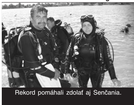
Rekord pomáhali zdolať aj Senčania.