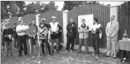
Cyklotrasu uviedli do prevádzky na polceste medzi Pezínkom a Sencom pri Galbovom mlyne.