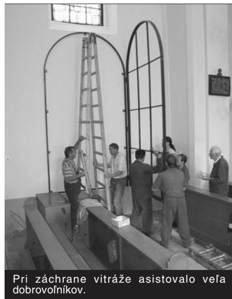
Pri záchrane vitráže asistovalo veľa dobrovoľníkov.