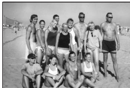
Juniorky DK Tajovského na letnom sústreďení v Taliansku.