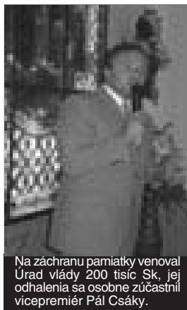
Na záchrany pamiatky venoval Úrad vlády 200 tisíc Sk, jej odhalenia sa osobne zúčastnil vicepremiér Pál Csáky.