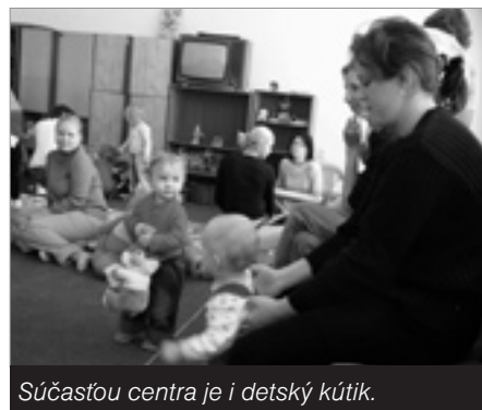
Súčasťou centra je i detský kútik.