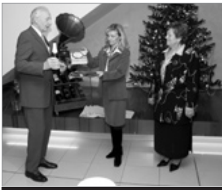
Krstilo sa šampanským