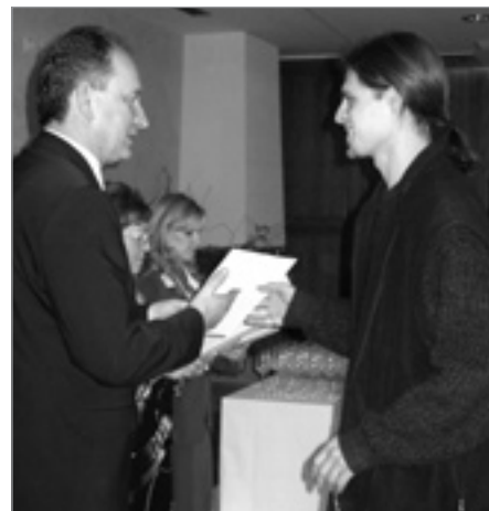
Primátor odovzdal autorom ďakovné dekréty.

Napadlo ma, že uznali moju spoluúčasť na dianí v Senci. Aj pri tejto príležitosti sa chcem Senčanom poďakovať, že majú takúto knižku. Je dôležitá pre registrovanie, čo sa stalo, čo bolo a čo bude. Srdečne ďakujem, že sme sa znášali po tie roky.