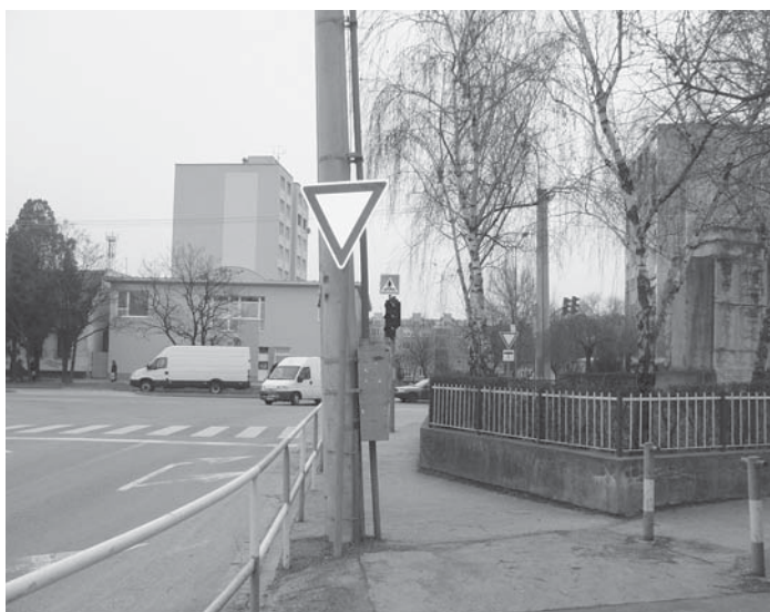
Moyzesova ul. a možnosť odbočiť doprava ku kostolu.