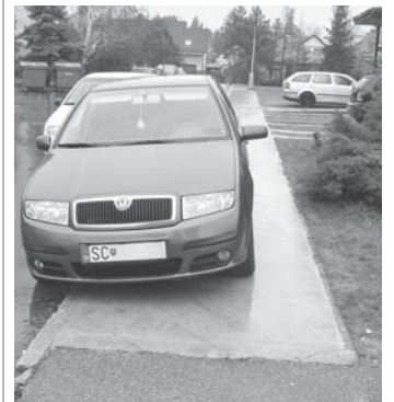
Tak takto nie...

- Vieme, že parkovacích plôch je málo. Budeme postihovať tých, ktorí nenechajú dostatočný priestor na chodníkoch, aby tadiaľ mohli bez problémov prejsť aj mamičky s kočíkmi či ľudia na invalidných vozíkoch. Pravidelne kontrolujeme aj vyhradené parkoviská. (el)