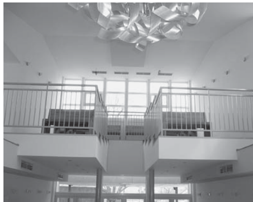
Dominantou je vyvýšená galéria

Vynovený dôstojný Dom smútku v Senci sa už využíva. Mesto ho zrekonštruovalo za zhruba 7 miliónov korún (približne 232-tis. eur). Dominantou interiéru je vyvýšená galéria, pribudli tak ďalšie priestory na sedenie. Nové lavice môže využiť do 65 ľudí. Vnútrajšok domu smútku je vykurovaný, kompletne zrekonštruovaný: vymenila sa dlažba, znížil sa strop, nové lavice majú mäkké čalúnenie, pribudla klimatizácia. Vynovené sú aj toalety, zrekonštruovaná je hygienická časť. Zateplená vonkajšia fasáda čaká na teplejšie jarné počasie, aby ju mohli dokončiť. Dve markízy umožnia smútiacim skryť sa pred nepriaznivým počasím či horúcim slnkom. Mesto upozorňuje, aby občania nezabúdali na obnovenie zmlúv na hrobové miesta po desiatich rokoch. (el)