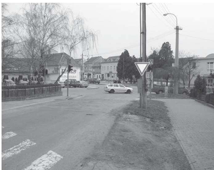
Ulica zhora od kostola s rovnakou značkou.