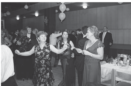
Hajnalok hajnaláig állt a tánc... Tancovalo sa až do rána bieleho...