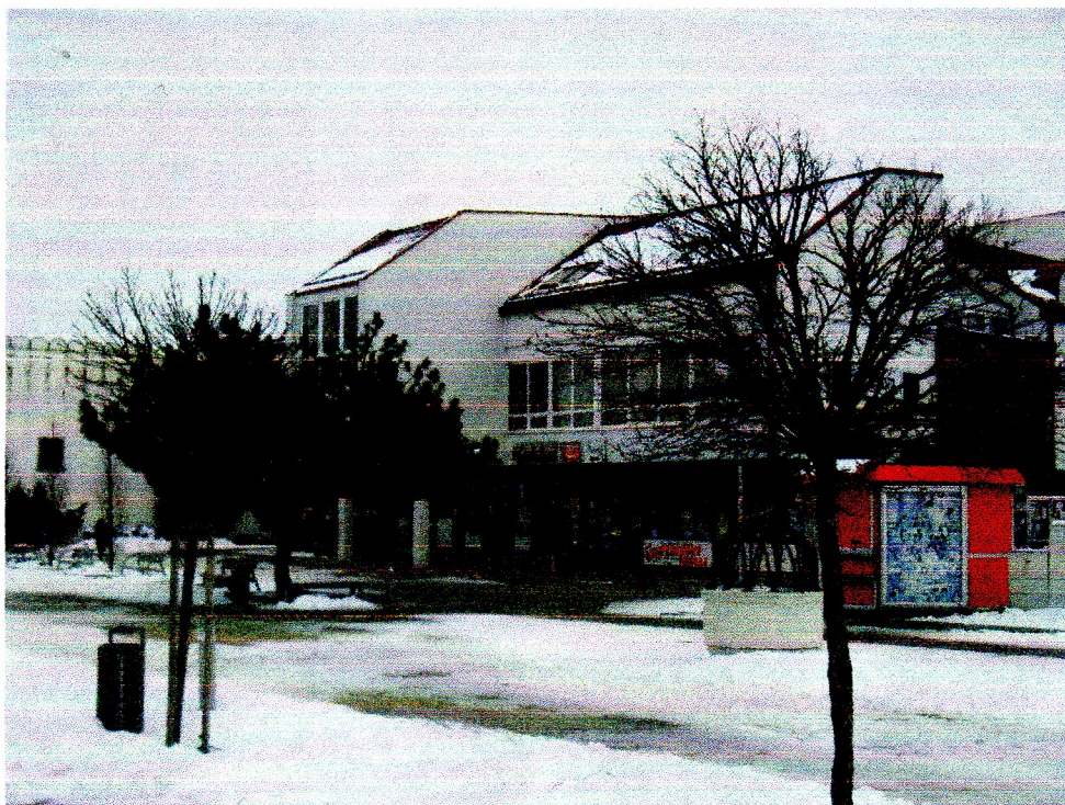
2/Niektoré druhy stromov majú malú korunu a tým tienia iba malú plochu