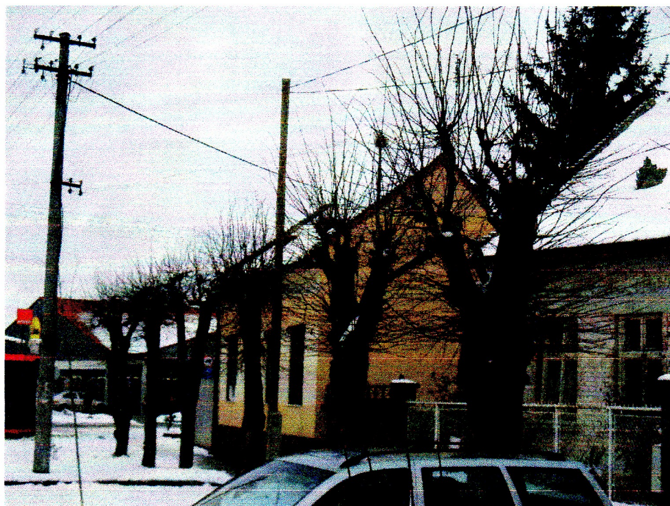
3/Jestvujúce staré stromoradia začali silno zrezávať pre elektrické vedenie